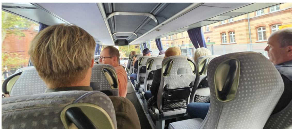
Noen turer i buss. Den lengste mellom Poznan og Gdansk