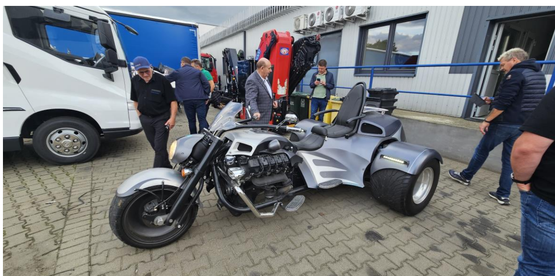
Grunnlegger og eier av Konar er en skikkelig Reodor Felgen. Blant annet hadde han bygget denne 8 sylindrede trike sykkel og en båt som kunne kjøre både på vann og på land