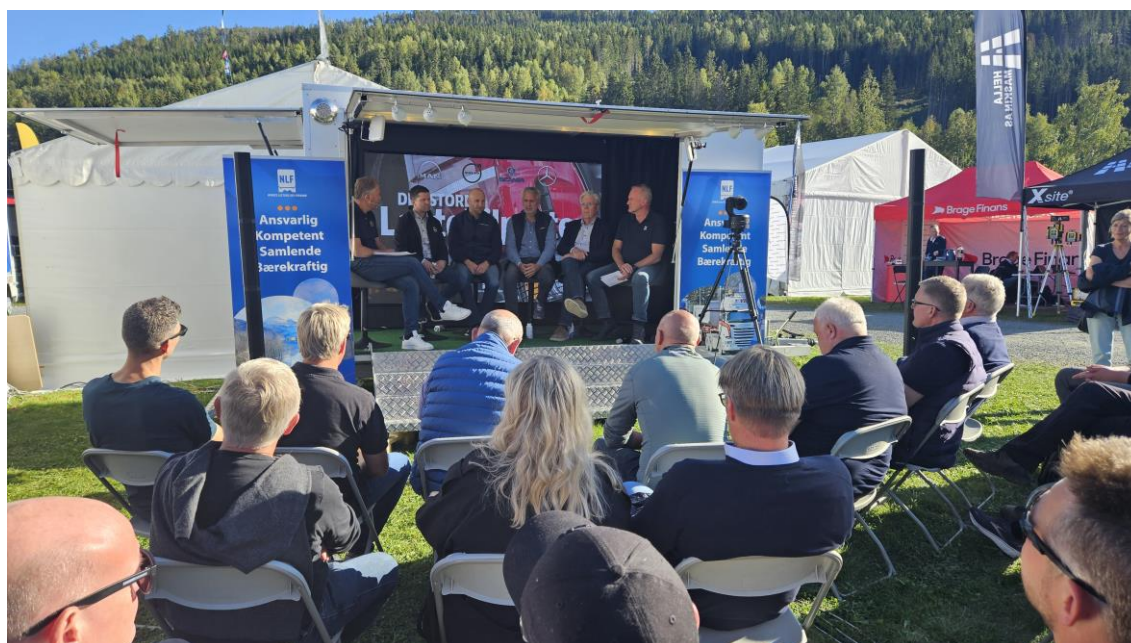
Publikum fulgte debatten både fra dyrskulplassen og digitalt

På tross av at statsministeren var på en annen scene for å åpne Dyrsku'n fant mange veien til NLF sin stand for å høre toppledere hos lastebilimportørene diskutere hvordan fremtidens transportløsninger vil bli.