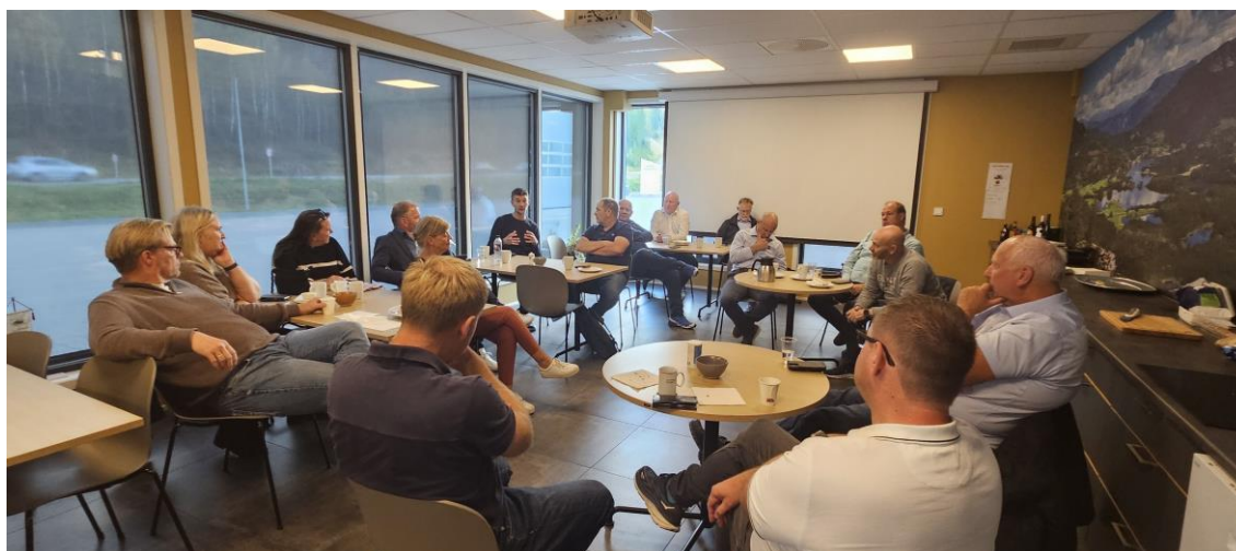
For første gang besøkte et samlet forbundsstyre Dyrsku'n. De rakk blant annet en befaring hos Telemark Bilruiter som er den største bedriften i Seljord. Forbundsstyret møtte også ledergruppen i NLF Region 3