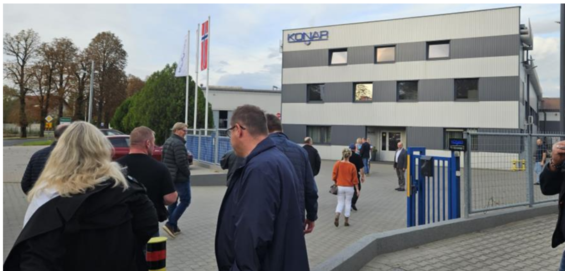
Det norske flagget heist utenfor Konarfabrikken når NLF delegasjonen ankom

Et 30-talls deltakere var med da NLF bedrifter i region 3 besøkte hengerprodusenten Konar og arrangerte fagreise til Polen.