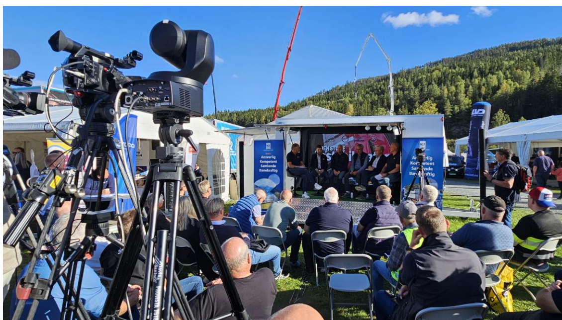
Med livesending ble det rigget til mye kamera- og lydutstyr