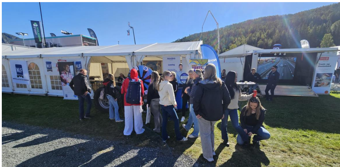
Interessert ungdom på NLF sin stand. Her en gruppe jenter som er tidlig oppe om morgenen for å høre om sjåføyrket og prøve seg på kjetting NM kvalifisering