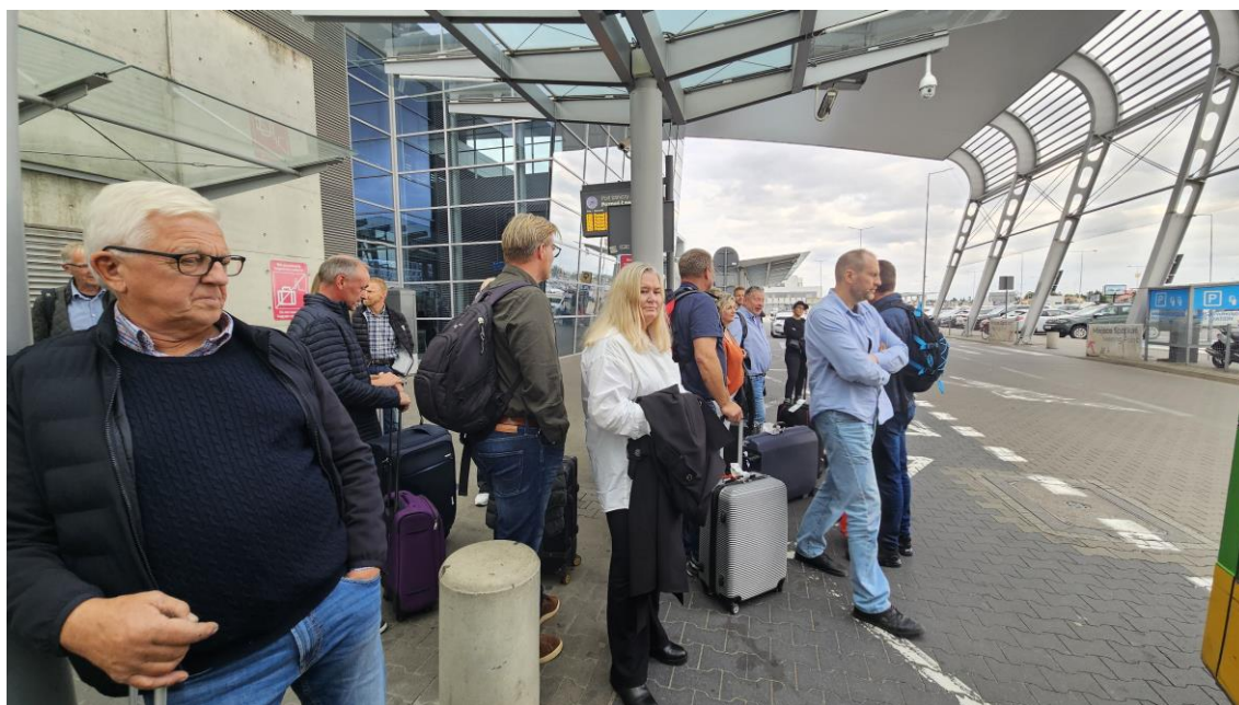
Utenfor flyplassen i Poznan