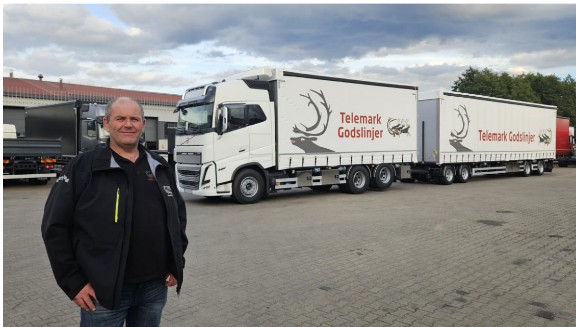
Kjøretøy klar for levering til Telemark Godslinjer.